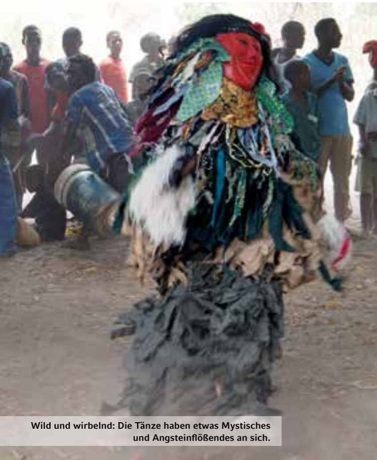
Wild und wirbelnd: Die Tänze haben etwas Mystisches und Angsteinflößendes an sich.

E in Monstrum mit rot-weißem Riesenkopf stürmt auf mich zu. Es dreht sich wild im Kreis, wirbelt Sand auf, bis es fast in einer Staubwolke verschwindet, und tritt Steinchen in meine Richtung. Es geht in die Knie, springt wieder auf, hüpfert, tobt, schaut mich bitterböse an. Sein fransiges Fell wippt mit, folgt jeder der wirren Bewegungen. Ein Veitstanz im afrikanischen Busch. Und war ich eben unter dem alten Amarula-Baum am Rande des Dorfes am Malawisee noch so eng von Kindern und Frauen umringt, dass ich mich kaum rühren konnte, weichen nun alle hastig hinter mich zurück. Endlich kann ich ungestört fotografieren. Oder wäre es weiser, den Einheimischen zu folgen, die dieses Mischwesen aus Teufel, Mensch und Tier offensichtlich für gefährlich halten? Als es immer näher kommt, zappelte ich unwillkürlich mit, folge nach Kräften seinen Verrenkungen. Und siehe da, der Bann scheint gebrochen. Eine Weile versucht es noch, mich einzuschüchtern, dann zieht es sich plötzlich zurück und entschwindet hinter der Trommlergruppe im Wald. Ein Trommelwirbel kündigt die nächste wilde Gestalt an, sie erscheint mit gelber Maske und langen Locken, dann folgt ein Geschöpf im weißen Federkleid mit schwarzem Schleier. Die Menge jöhlt, und den Trommlern rinnt der Schweiß übers Gesicht.