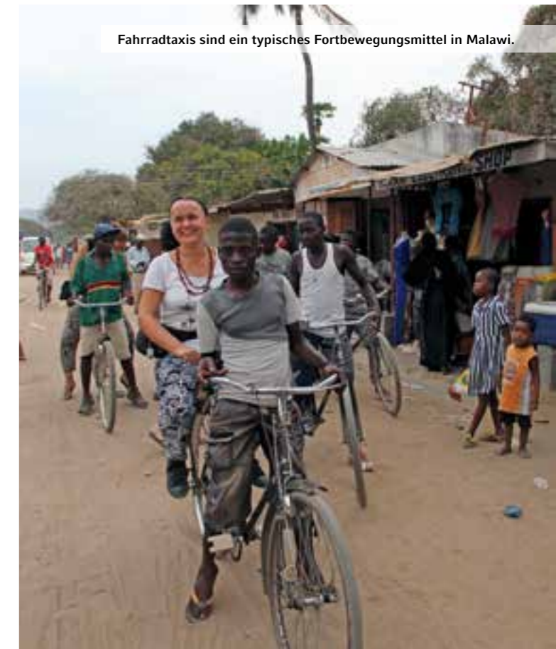
Fahrradtaxis sind ein typisches Fortbewegungsmittel in Malawi.