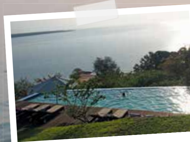
Pool mit Seeblick in der Pumulani Lodge: ein wahrer Urlaubstraum!

Die Attraktionen des Malawisees sind noch weitgehend unbekannt. Wer weiß schon vom weltweit ersten Süßwasser-Nationalpark, von Luxus-Lodges und Welterbe-Maskentänzen an seinen Ufern. Malawi, das schon David Livingstone, Queen Mum und Haile Selassie bereisten, versucht, sich in der Nische jenseits des Massenmarktes zu behaupten.