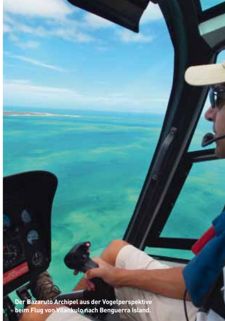
Der Bazaruto Archipel aus der Vogelperspektive beim Flug von Vilankulo nach Benguerra Island.