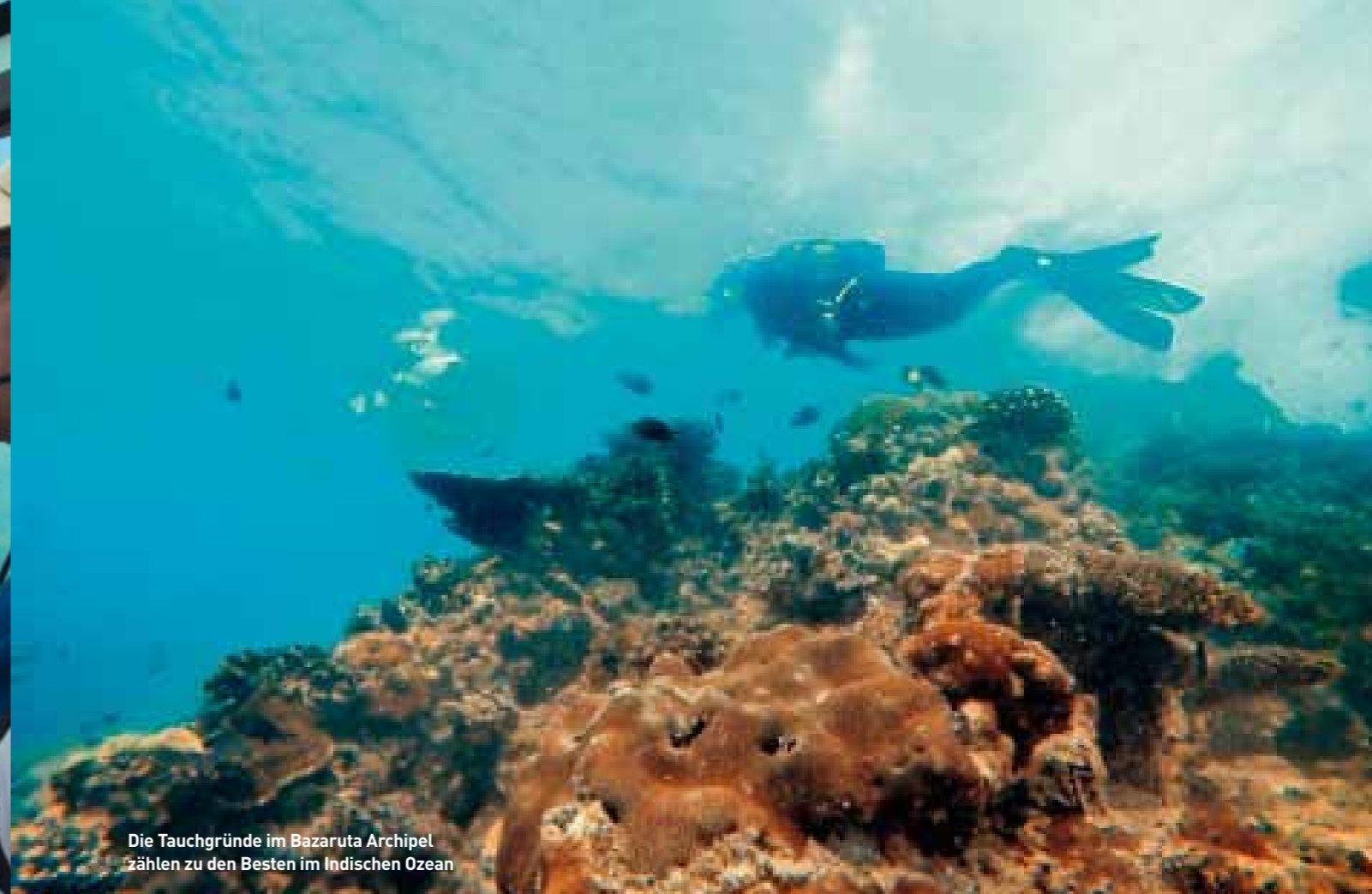
Die Tauchgründe im Bazaruto Archipel zählen zu den Besten im Indischen Ozean