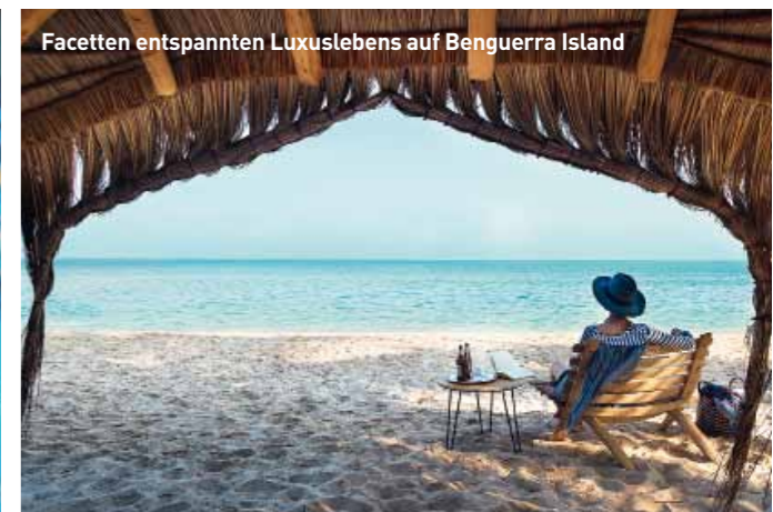
Facetten entspannten Luxuslebens auf Benguerra Island